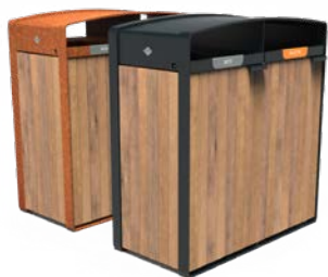
STORR 2 ENTRÉES 100L BOIS