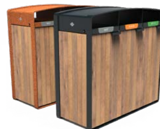
STORR 3 ENTRÉES 70L BOIS