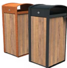
STORR 100L BOIS