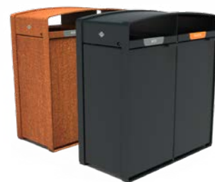
STORR 2 ENTRÉES 100L